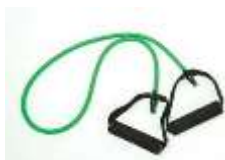
Goma elàstica tubular