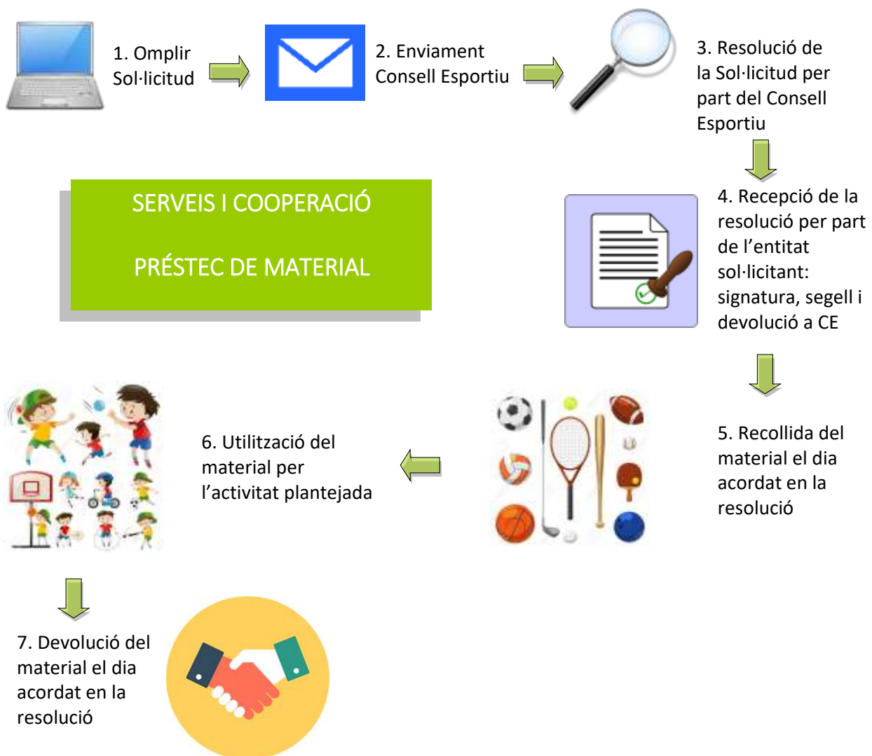
Diagrama del procés